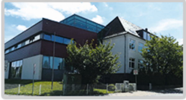
Jahnstraße 2 32312 Lübbecke